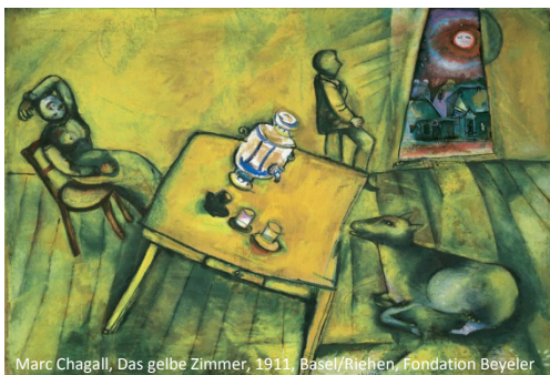
Marc Chagall, Das gelbe Zimmer, 1911. Basel/Riehen, Fondation Beyeler